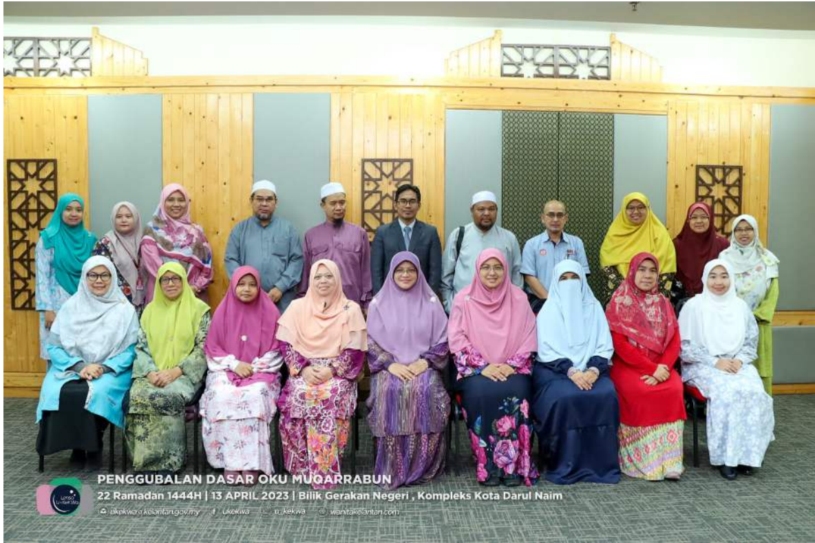
PENGGUBALAN DASAR OKU MUQARRABUN 22 Ramadan 1444H | 13 APRIL 2023 | Bilik Gerakan Negeri , Kompleks Kota Darul Naim @dkekwa.kelantan.gov.my | Ukekwa | ukekwa | www.kelantan.com